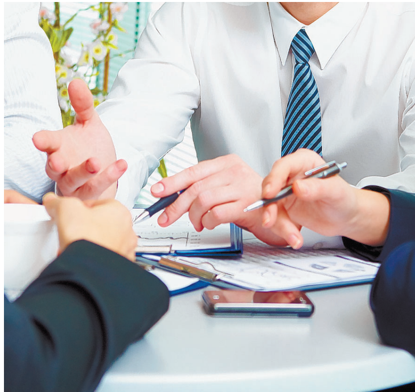
Bald beginnen die jährlichen Lohnverhandlungen zwischen dem Arbeitnehmerverband und den verschiedenen Branchen.

Branchen eingeführt, teilweise werden Löhne in Euro ausgezahlt. Ist das aus Sicht des LANV angesichts der schwierigen Lage für Exportbranchen akzeptabel? Die Auszahlung von Löhnen in Euro befürworten wir grundsätzlich nicht. Wir sehen, dass es eine Massnahme sein kann, wenn eine Firma trotz guter Auftragslage aufgrund der geringen Marge und des starken Frankens Gewinneinbrüche oder sogar Verluste hat - und wenn die Alternative die Auslagerung der Firma ist. Diese Massnahme können wir nur billigen, wenn sie klar kommuniziert ist, wenn sie mit den Betroffenen individuell angesprochen wird und sie befristet ist. Aber unsere Prämisse ist: Wenn man in unserem Land Dienstleistungen oder Produk-